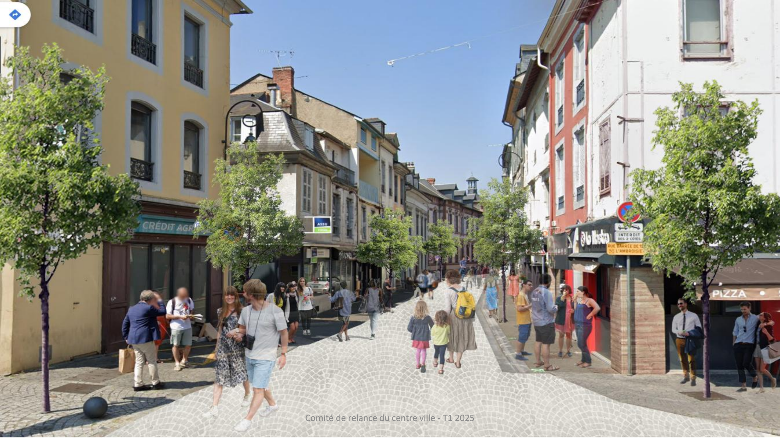
Comité de relance du centre ville - T1 2025