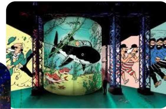
Atelier des Lumières

Ambiance festive assurée avec la Street Food qui accompagnera les différentes manifestations