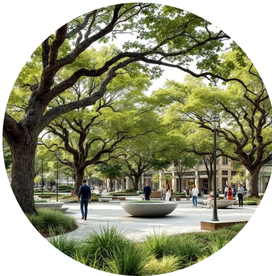
Places Publiques Ombragées