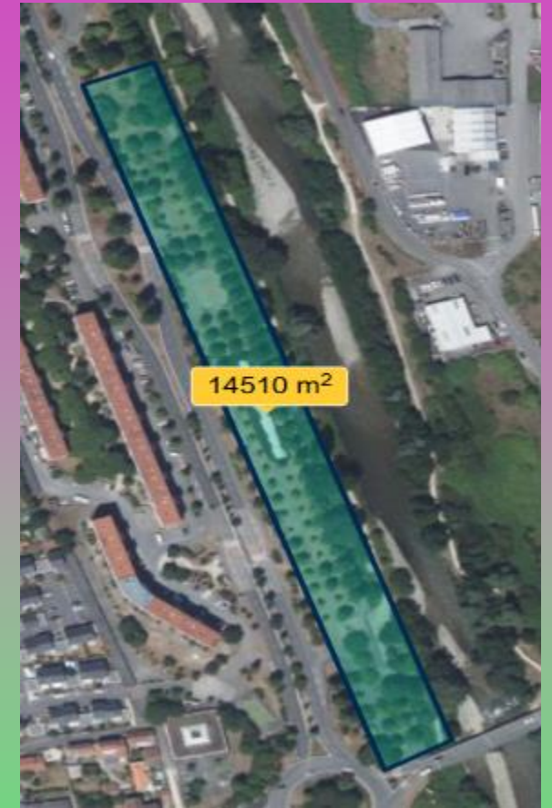
Bord de l'Adour